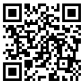
ぐだぐだぶとんホームページ - VR-TRPG の始め方

VR-TRPG の遊び方が分からない方は、ぐだぐだぶとん公式 HP をご覧ください。